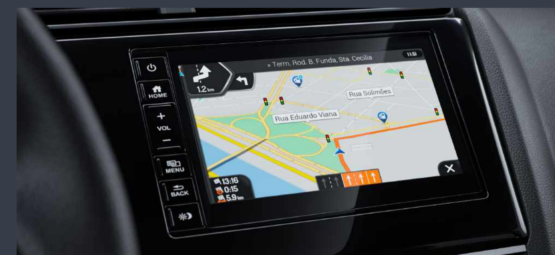
Navegador GPS com mapa multivisão