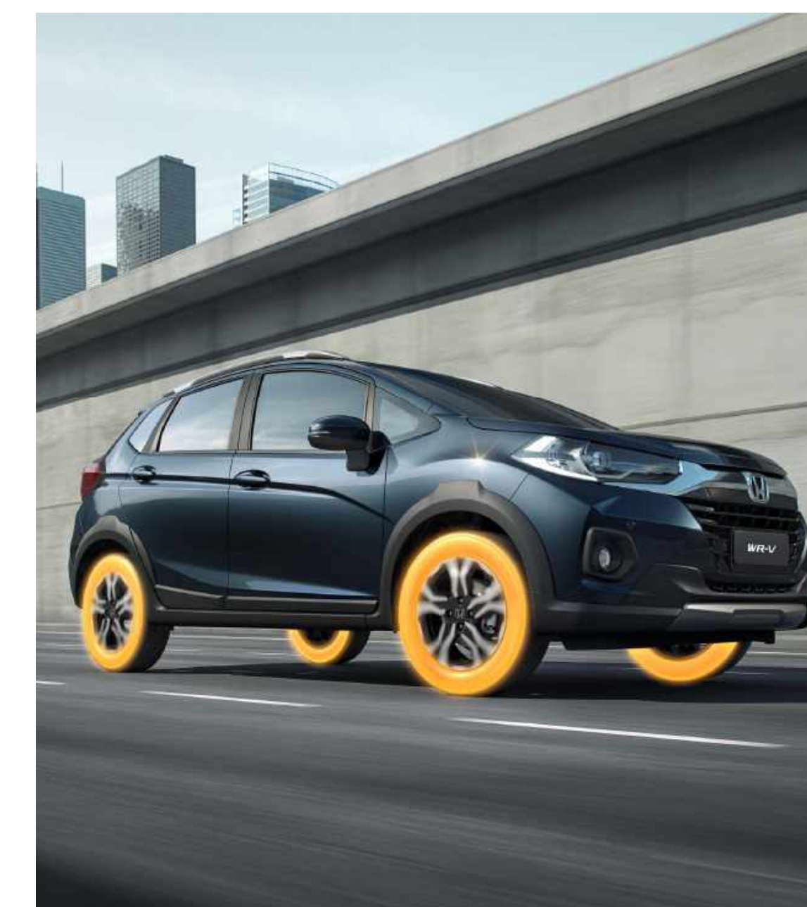
Sistema TPMS - monitoramento de pressão dos pneus