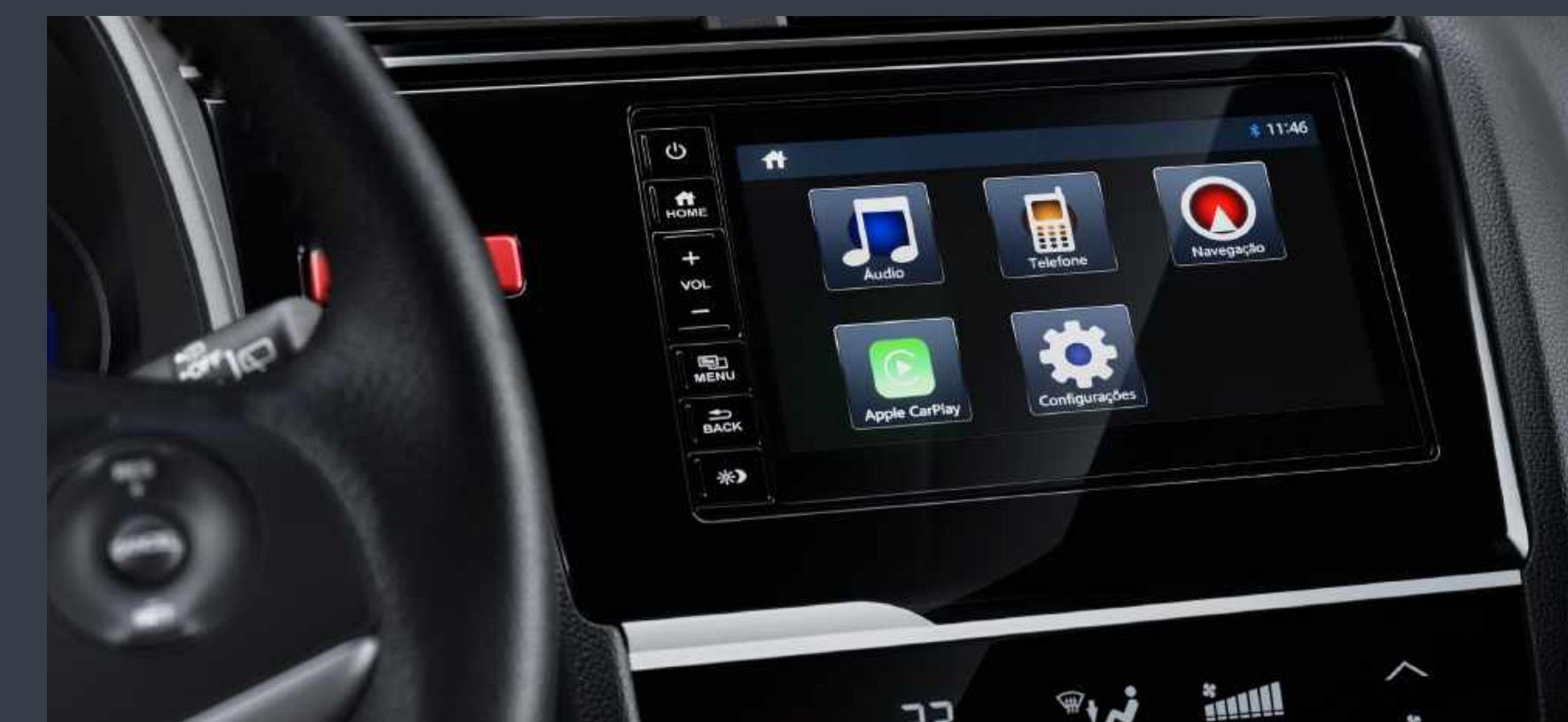
Multimídia de 7" com interfaces Apple CarPlay® e Android Auto™

O Honda WR-V também oferece, a partir da versão EX , ar-condicionado digital com função de ajuste automático de temperatura, intensidade e fluxo de ar para a climatização ideal de suas viagens. Além disso, ambas as versões EX e EXL agregam também direção com piloto automático e Paddle Shifts para você aproveitar ao máximo todo prazer de dirigir.