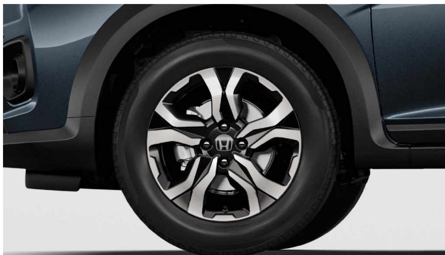
Rodas de liga leve 16".