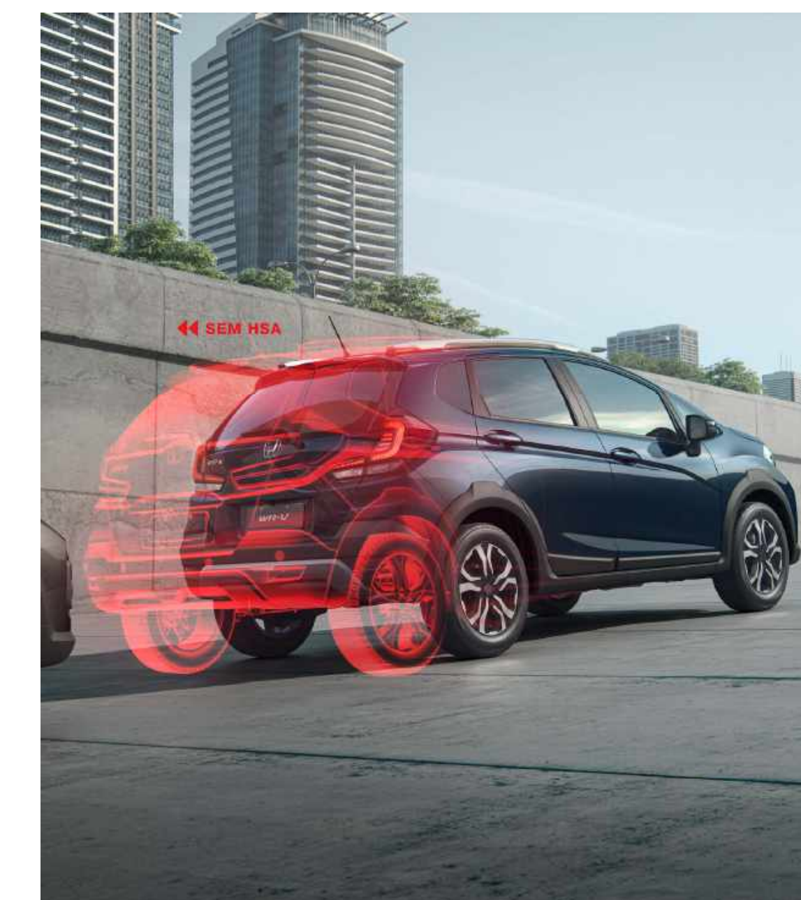
Sistema HSA (Hill Start Assist)®