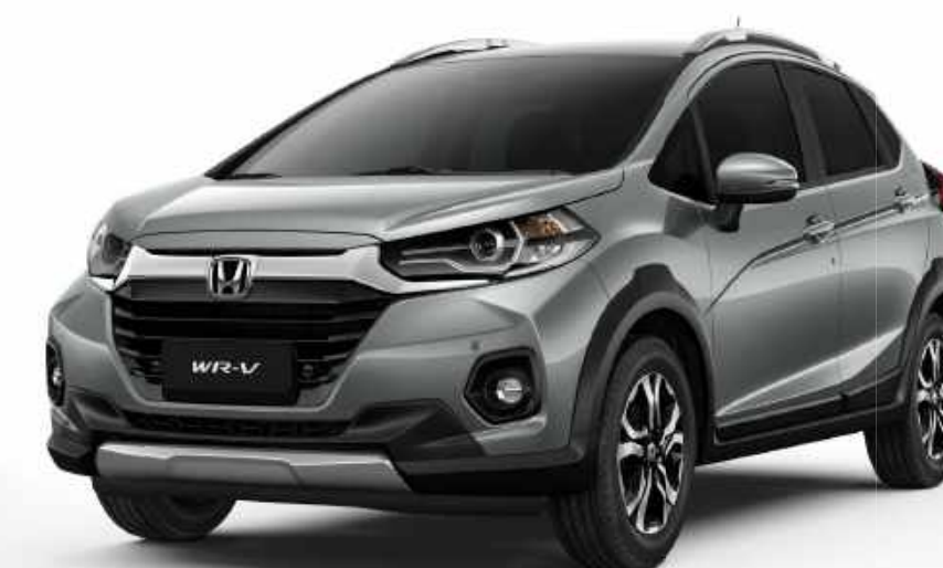
Prata Platinum Metálico