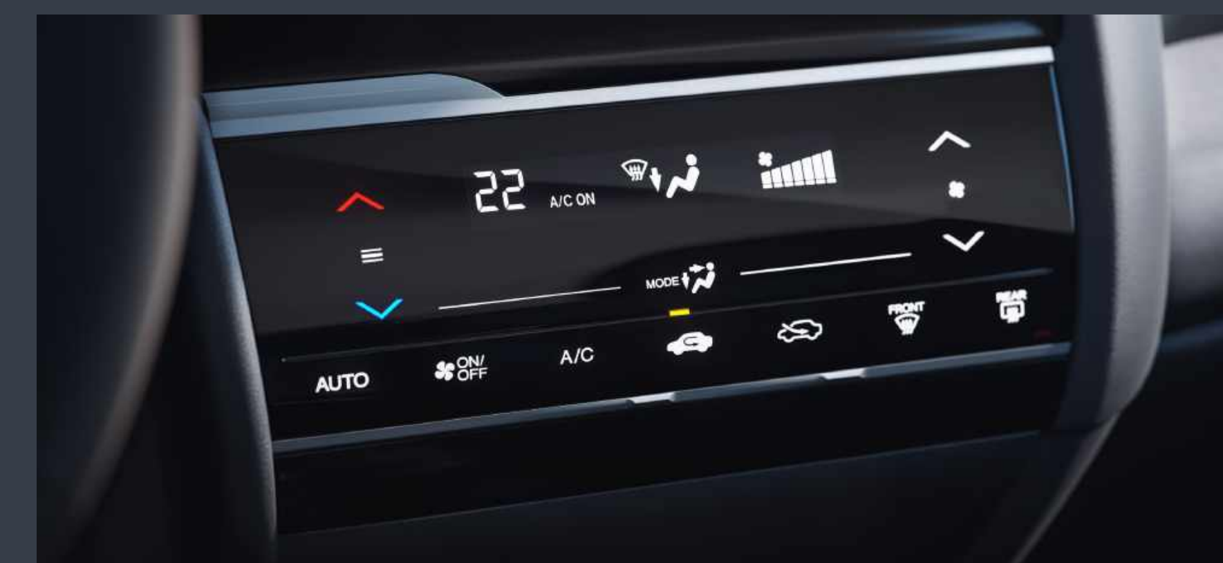
Ar-condicionado digital/automático com tela Full Touchscreen