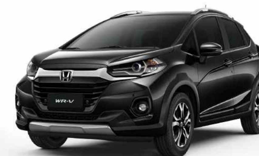
Preto Cristal Perolizado