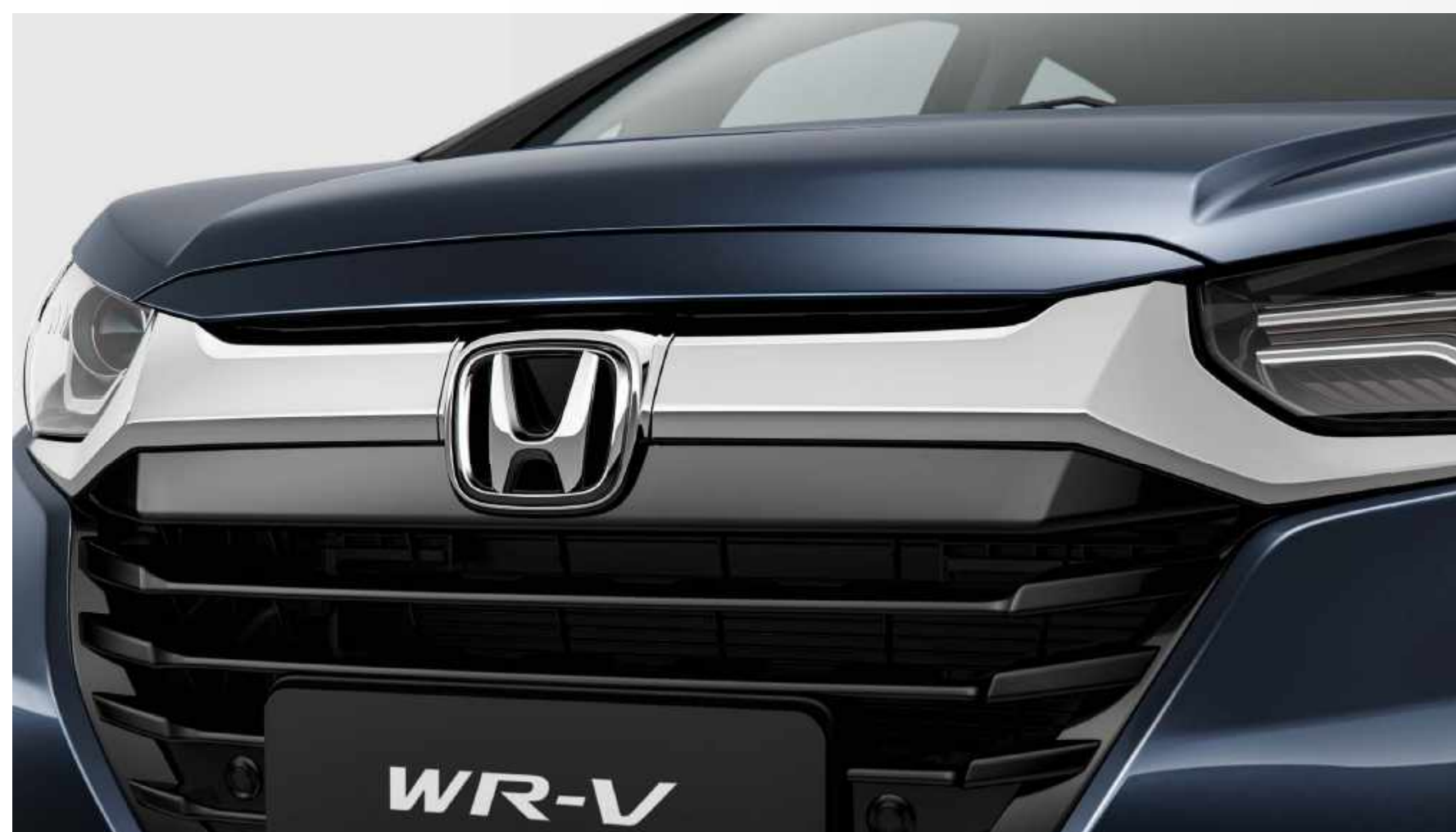
Grade frontal cromada com acabamento BlackPiano.