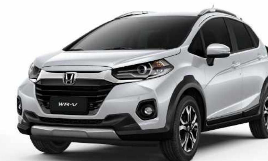
Branco Tafeté Sólido

Um carro que tem tudo o que você precisa para ver a vida de outro ângulo.