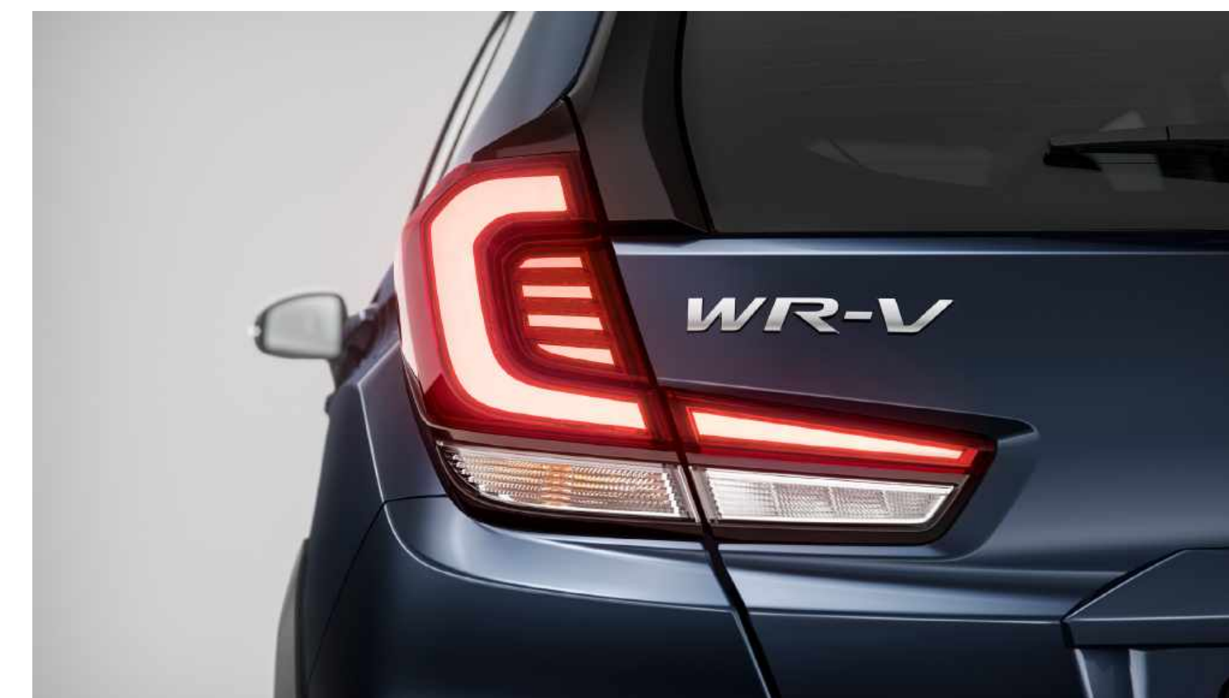
Lanternas traseiras em LED.