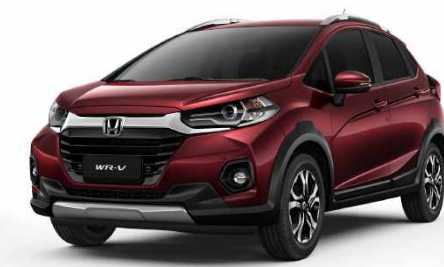
Vermelho Mercúrio Perolizado