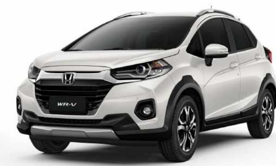
Branco Estelar Perolizado