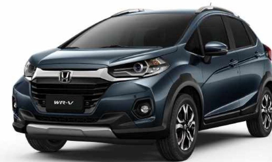
Azul Cósmico Metálico