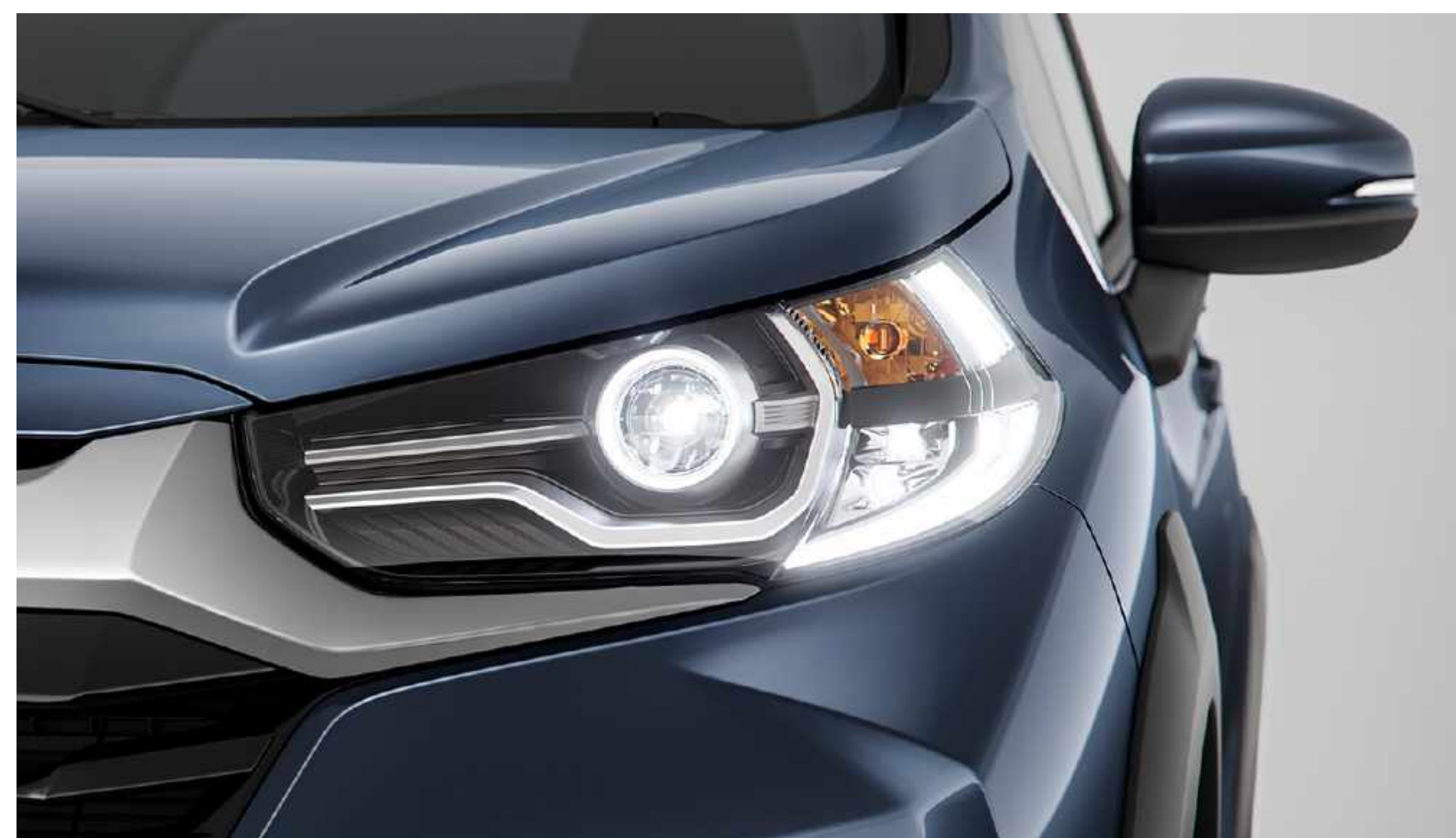
Faróis, luzes de rodagem diurna e neblina em LED.